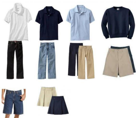
Uniform Shirt Colors: Navy Blue, Light Blue & White