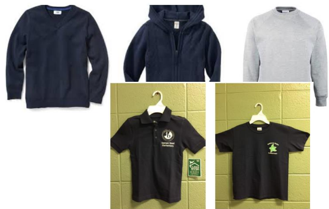
Polo with Logo $10.99